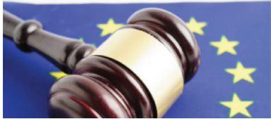
Table des matières

Que vous soyez télépilote de drone à titre de loisir ou professionnel, vous êtes soumis à la nouvelle réglementation européenne, mise en place depuis le 1er janvier 2024.